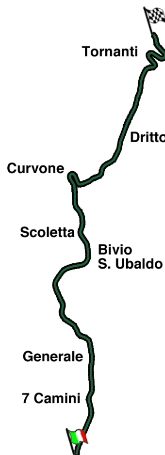
Tracciato Trofeo Luigi Fagioli

Il programma completo e dettagliato, la scheda di iscrizione e tutti i contatti sono disponibile sul nostro sito web www.trofefagioli.it